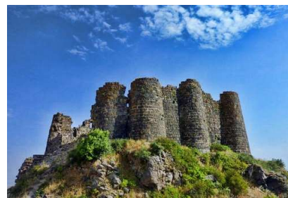
Руины крепости Амберд