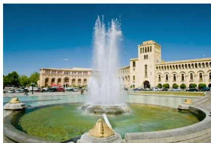
Площадь Республики, Ереван