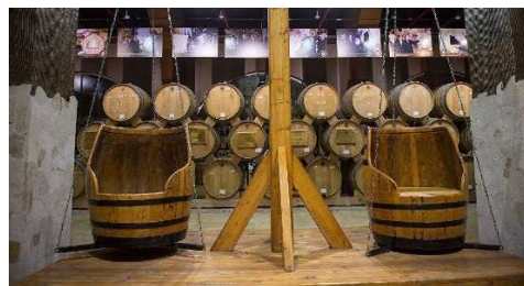
Ереванский коньячный завод

Цена на 1 человека, доллары США (в зависимости от количества участников)