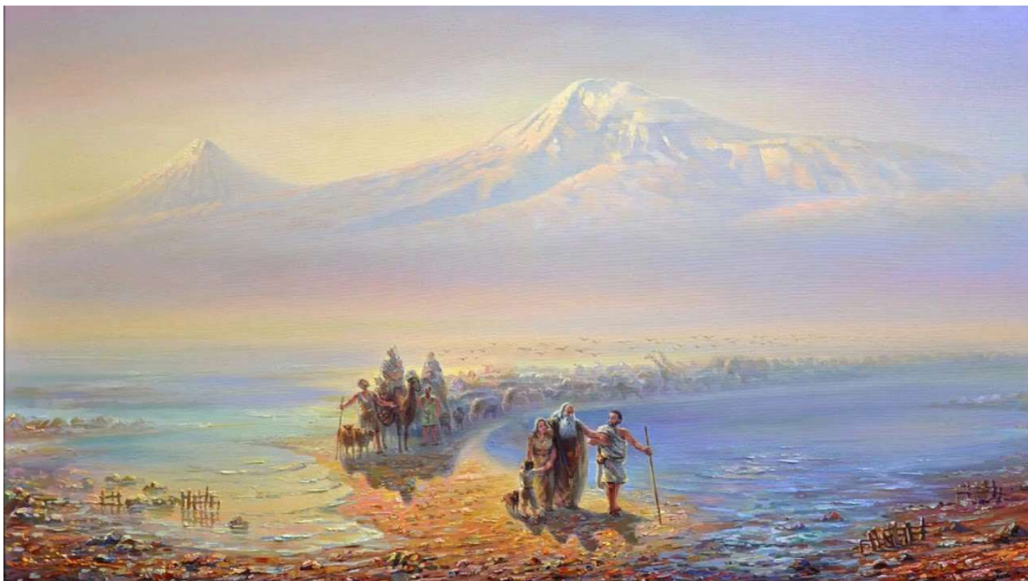
Художник – Иван Айвазовский, «Сошествие Ноя с горы Арарат» 1889 год

Выбирая АрмеТур, вы выбираете качество, комфорт и искреннюю любовь к нашей стране. Позвольте нам показать вам Армению такой, какой мы её знаем и любим. С нами ваше путешествие станет незабываемым!