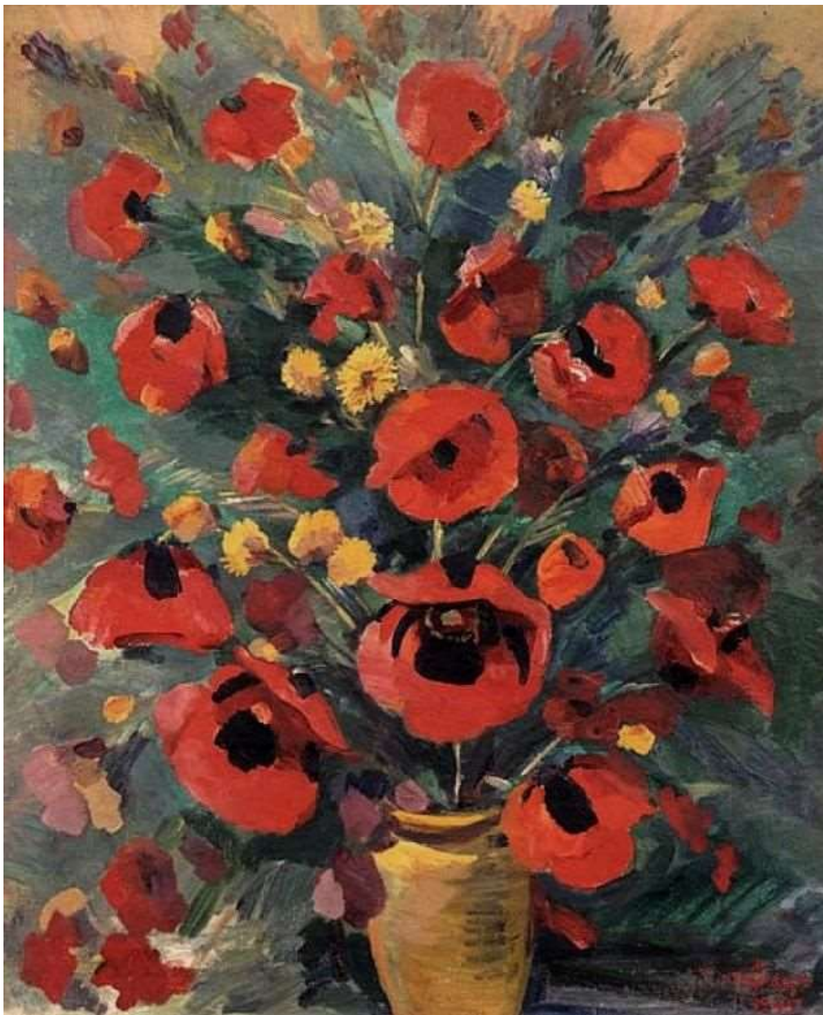
Художник – Мартирос Сарьян, «Полевые маки»